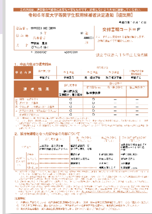
▲候補者決定通知【提出用】

給付採用者は、第1種の貸与月額が減額されます。 貸与が必要な方は、下記の在学採用にて第2種の申し込みを検討してください。 既に第2種も採用されている場合は、最大12万円まで増額していただけます。